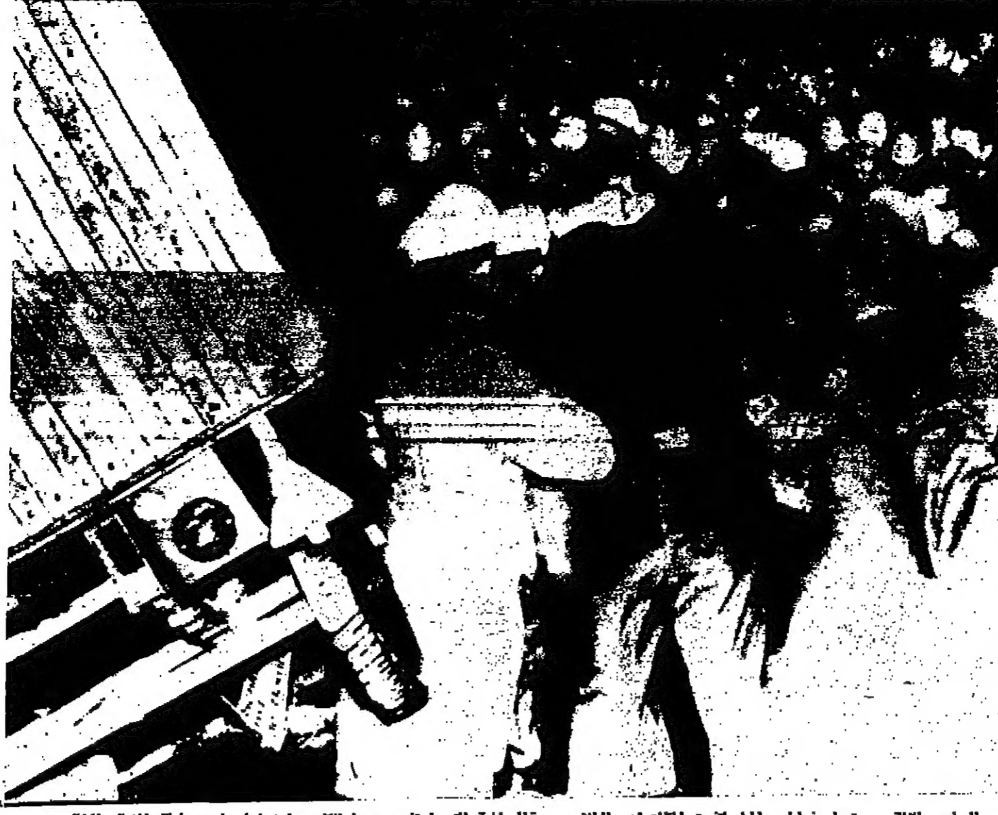
الوليس الاتي يستعمل خراطيم المياه تفريق المظاهرات الطلابية الصليحية التي اجتمعت فرائكوتوت احتجاليا على محاولة اغتيال الطلاب الاتي رودي دوشك « صورة للبوليس »